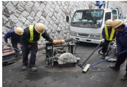
①パラボラカッタによる円形球面切断