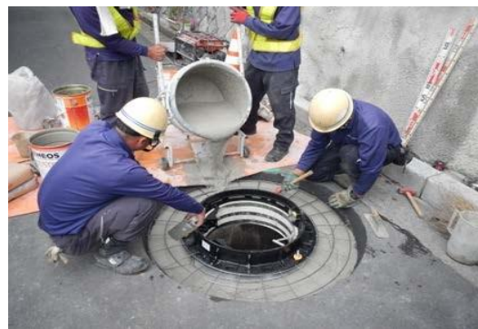
⑤無収縮モルタル（ネオフィット）打設