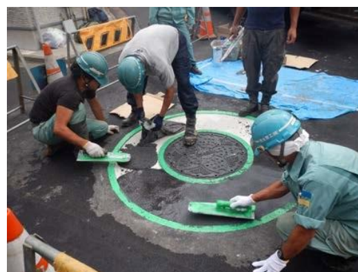
⑦-2 表層材敷設（パッチグーP）